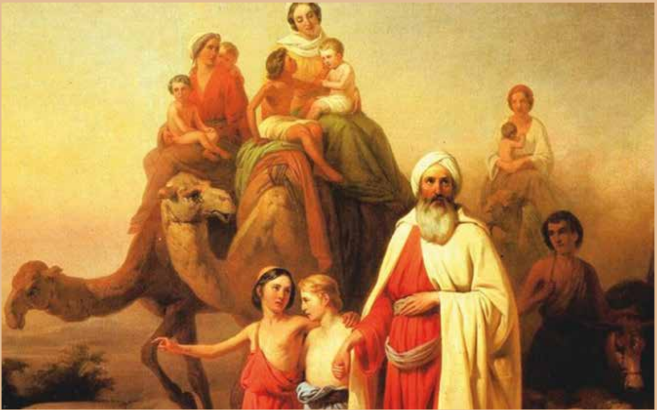
“Abrahams Børn” Maleri af József Molnar, Ungarns Nationalgalleri